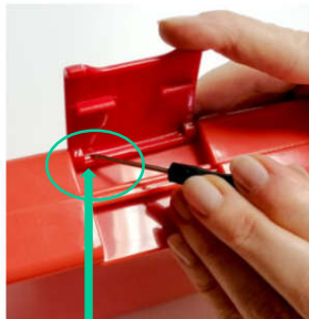
Versteckten Metallstift in die Box schieben